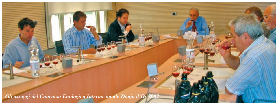
Gli assaggi del Concorso Enologico Internazionale Douja d'Or 2007

Le domande, con l'allegata documentazione prescritta, devono essere consegnate a mano