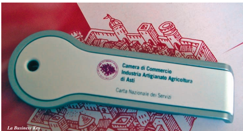
La Business Key

D al 17 dicembre 2007 vanno a scadenza i certificati di firma digitale e le Carte Nazionali dei Servizi rilasciati a partire dal 17 dicembre 2004. Il rinnovo potrà essere effettuato, entro i 90 giorni antecedenti la data di scadenza, accedendo al sito www.card.infocamere.it oppure presso l'Ufficio Registro Imprese, previo appuntamento (tel. 0141/535105).