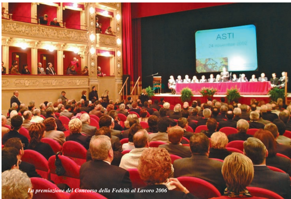
La premiazione del Concorso della Fedeltà al Lavoro 2006