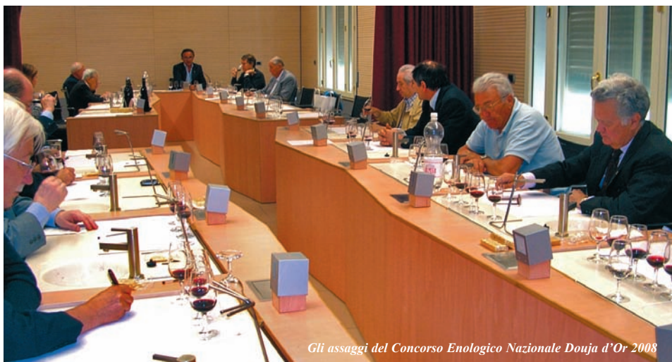
Gli assaggi del Concorso Enologico Nazionale Douja d’Or 2008